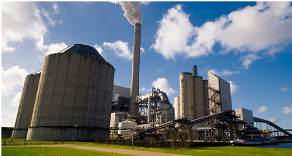
Ilustração opcional. Talvez mostrar a Empresa, o UniBrasil ou ambos.